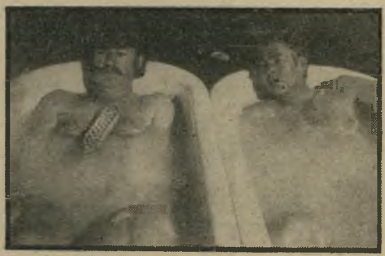
הקמן וקובורן — לאהוב אדם או סוס?

אלא שכל המרכיבים הללו הופכים, בצורה זו או אחרת, לבדיחות קלות. האיש האהוב סוסים, גבר אמיץ במיטב מסורת המערב, דואג לקבור גוויית סוס שנפח נש-מתו מרוב מאמץ. אבל משאיר גוויית אנושיות לעוף ה-שמיים. הנער המתמרד, אחרי שזכה למנת מכות נאמנות, הופך לחתול מנומס ביותר, והחינוך של הסבתא עדיין שולט ברמה. הידידות הגברית המופלאה היא אוסף של ג'סטות, ואילו האשה המשוחררת משתתפת, בסופו של דבר, במירוץ, מתוך מניעים בלתי-משוחררים לחלוטין. מצילים במיקצת את המצב השחקנים. ג'ין הקמן ו-