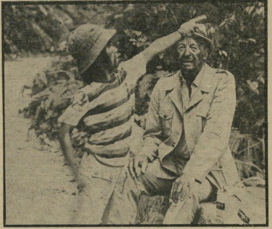
ניבן: מי גיבור יותר ממי?

מאחר והתסריטאי כאן הוא ג'ק דיוויס, מומחה לי מצחיקונים בריטיים (כמו צחוק בנן עדן או סידרת ה-רופאים במישפחה) כתוב הסרט ברוח מבודחת, עם הרבה תקריות מצחיקות, אפילו כשהעלילה דרמטית. ילד יפאני חיכן ומנומס גונב סצינות בקבלנות, ואילו דויד ניבן (כמורה לאנגלית) וטושיירו סיפונה (שגריר יפאן), שולטים במצב בכל רגע. מעניין שדיוויס, בעזרת הבמאי קן אונאי קין, הטיל על שני השחקנים הללו תפקידים הלועגים בעצם לתדמיתם הקולנועית הקבועה: ניבן, שהיה גם בחיים וגם בקולנוע קצין בריטי מצטיין, מופיע כאן כמת, חזה כקצין, ואילו יפונה, התגלמות הסאמוראי הקולנועי, אינו מסיר את חליפתו אלא בסצינה אחת, כשהוא לובש קימונו, נוטל חרב עתיקה מן הקיר, עושה כמה תנועות מאיימות בה, ומחזיר אותה למקומה.