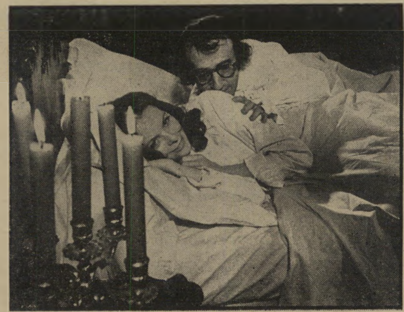
אלן ודיאן קיטון, הגוף הוא היחיד שעושה חיים!"

איכות וממות באהבה. וכך מגיע בוריס, כלומר וודי אלן, אל סף הפיתרון של החידה שהעסיקה אותו בסרטו הקודם. אלן, הליצן האינטלקטואלי, המגנן קלרניט בתזמורת־ג'ז, עומד להסביר את פשר המוות והחיים: "האדם מורכב מגוף ומנ־פס. הנפש שואפת אל כל האצילי והנשגב, כמו פיוט ופילוסופיה, אבל הגוף הוא היחיד העושה חיים. העיקר לא להיות ממורמר, ואם יסתבר בסופו של דבר שיש אלוהים, אינני חושב שהוא רשע. לכל היותר, אפשר לומר שמלאכתו היא פחות ממושלמת.