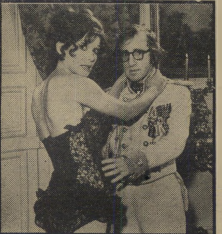
וודי אלן ואולגה ג'ורג' סיקו, גם אחרי המוות יש בחורות!"

בניכרונת־הילדות הראשונים שלו, זוכר בוריס את אביו, הקשור כל כך לפיסת־הקרקע שלו, ואז רואים את האב מוציא מכיסו פיסת־קרקע ומכריז: "אדמה זו אינה למכירה. אני מקווה שאוכל לבנות עליה, ביום מן הימים!" כומר אורתודוכסי משוחח עם בוריס הר צעיר על מהות היקום, ומסביר לו מה זה יהודים, תוך הצגת קריקטורה של יהודון עם קרניים. "לכל היהודים יש קרניים?" שואל בוריס. "לא, רק לרוסים" משיב הכומר. "ליהודים מגרמניה יש פסים כ־ אלה," והקריקטורה מראה כותנת של מח־נותריות. לרגעים, כשנדמה שהפילוסופיה עומדת