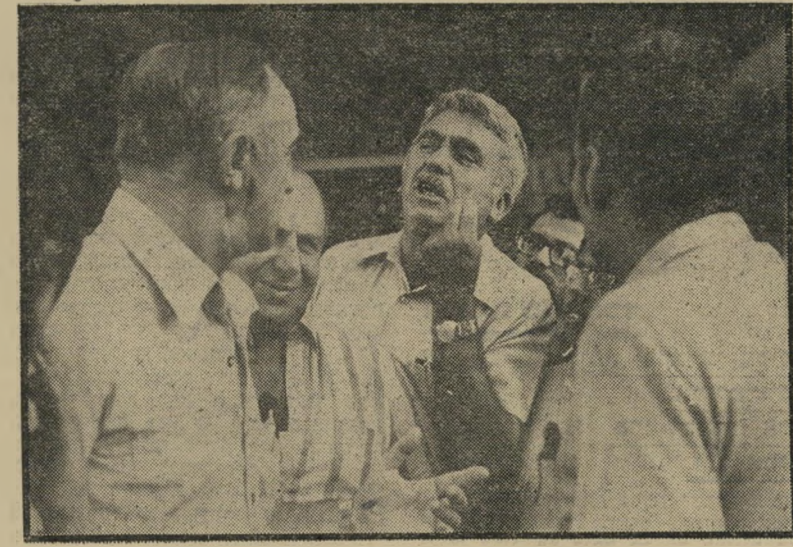
מהמרי הטוטו מתווכחים על התוצאות מכירה פומבית של זכויות

אללת-המול שיהקה הפעם כנגד ה' מהמרים. מתוך 13 התוצאות של מישחקי הניחוישים השבת הסתיימו 8 מישחקים ב' תוצאת תיקו, כיוון שמרבית המנחשים ניחשו בטפסי ניחוישים של כפולים ומשול' שים, הימרו רובם על תוצאת התיקו. כי