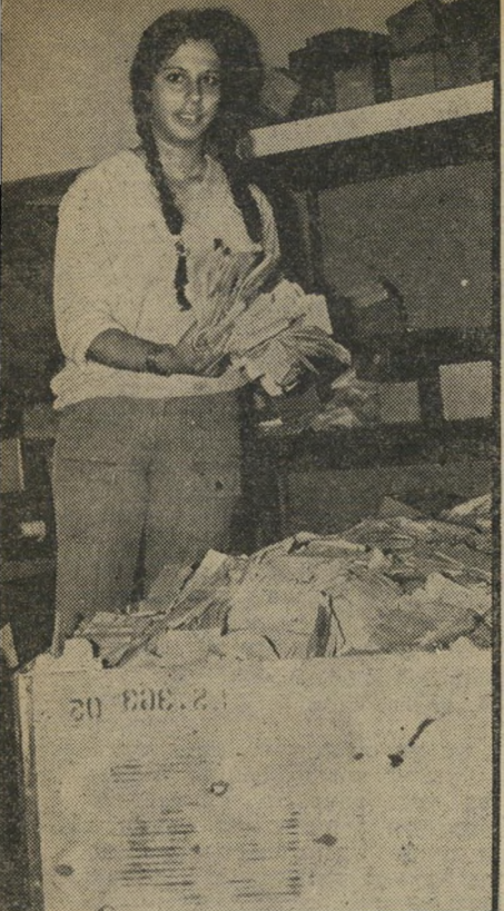
פקידת הטוטו ממוינת טפסים אלילת-המול לענה