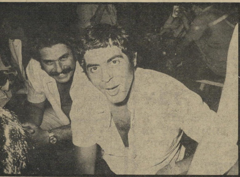
ספק לוי מספק

התחמקות האוצר מגביית היטלי-הפי-חות מעוררת גיחוך. ראשית, רשאי ה"מכס להימנע להוציא רישיונות-ייבוא לכל יבואן שעבר עבירה, ומסרב לשלם את ההיטל והקנס. כך יכול האוצר בקלות, לגבות את כל הסכומים המגיעים לו. שנית, יכול האוצר לזיזם הקמת בתי-דין לעבירות-מכס, כדוגמת בתי-הדין ל"תעבורה או לעבודה. באמריקה פועלים מזמן בתי-דין לעבירות-מכס, המשחרים את בתי-המישפט הרגילים מעומס תבי-עות המכס.