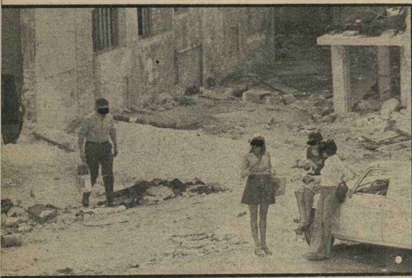
4 כמה דקות לאחר שהלך עם הזונה אל הכוך, סיים הלקוח את מעשיו. הוא הולך לדרכו, הזונה עדיין מתעכבת בתוך הכוך. שלוש החברות ממתנינות במקום ללקוח הבא. התנועה במקום רבה, עשרות אנשים באים בשעה. המחיר מ-50 ל"י.