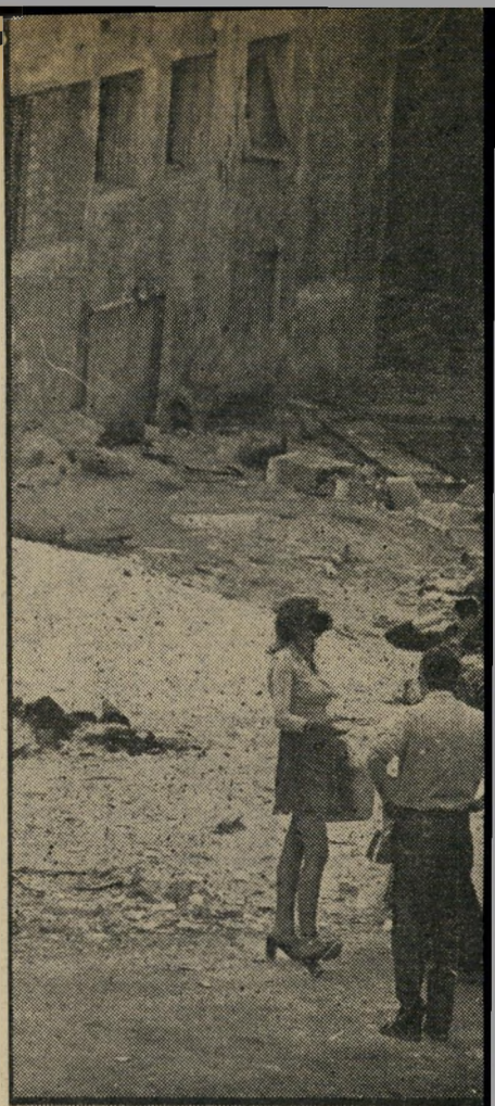
2 הירקון, מתקיימת בשעות הבוקר פעילות ענפה זשבים, בהם ילדים, הזונות מתרכזות במיגרש, מגיע אל מיגרש החנייה. אחת הזונות (באמצע) באיזו אשה מבין השלוש הממתנות הוא חפץ.

3 "אני גרה באיזור מהוגן, השכנים לא יודעים שאני זונה וגם לא המישפחה שלי. אני מקפידה שהחיצוניות שלי תהיה יפה ונאותה, ואני בשום פנים ואופן לא מוכנה לשלם מס הכנסה בשביל שמיכאל צור או טיבור רוני ביום יוכלו לגנוב מהמדינה."