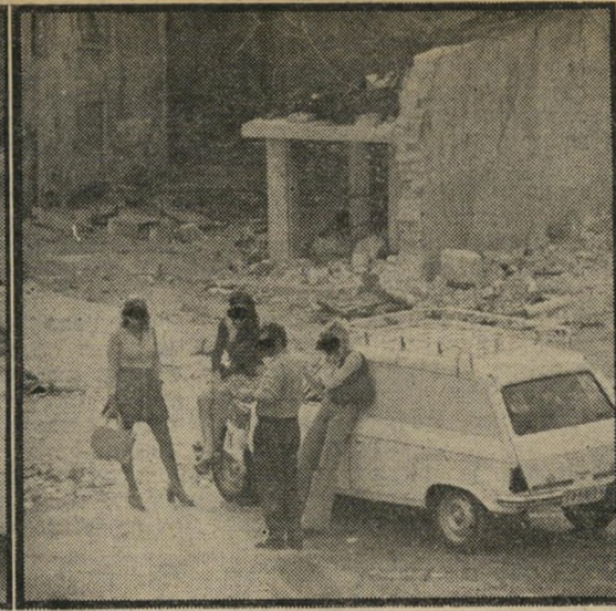
1 הלקוח עדיין מהסס. הזונות עומדות במקומן. האמצ' עית, שהתמתחה, הבינה כי אבוד לה איתו, התיישבה על המכונית. הזונה הבלונדית (מימין) אחזת בלקוח, משדלת אותו לבוא איתה אל הכוך, אתר הביצוע.