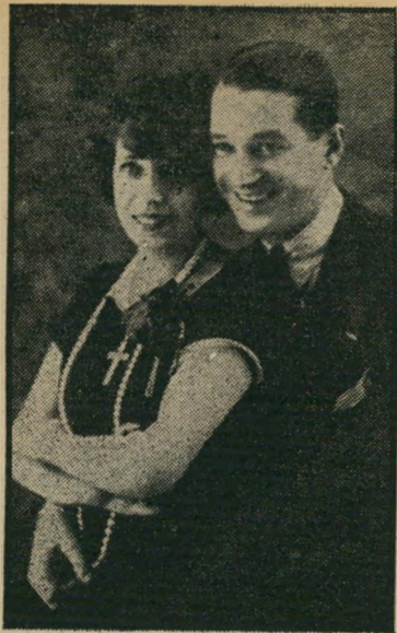
מנחג אשכנזי קדום. בתימן נוחגים ל-חדש חומה ובסין צהובה. ויש לחקפיד שלא לערב עם "חידוש לבנה" הנעשה בי-מישרד הרישוי מדי שנה.

מערכת הארץ דאגה לפרסם פעמיים במשך השבוע שעבר את התמונה הנוראה, שהעבירה צמרמורת בלב רבים. התמונה המפחידה והמור-כרת לכולנו משנות השלושים, הורכבה משתי תמונות - של יהושע פרץ ושל קהל המפגינים. הכותרת היתה, בשתי הפעמים: "יהושע פרץ מברך במועל-יד את אוהדיו". חד-חלק. הנא-ציזם טרם חלף מן העולם. יורשם של היטלר ומוסוליני חי וקיים בישראל.