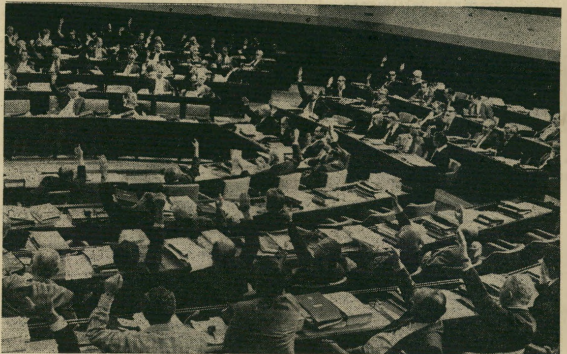
חברי הכנסת מקרמים במועל-יד את ה"פיהרר"