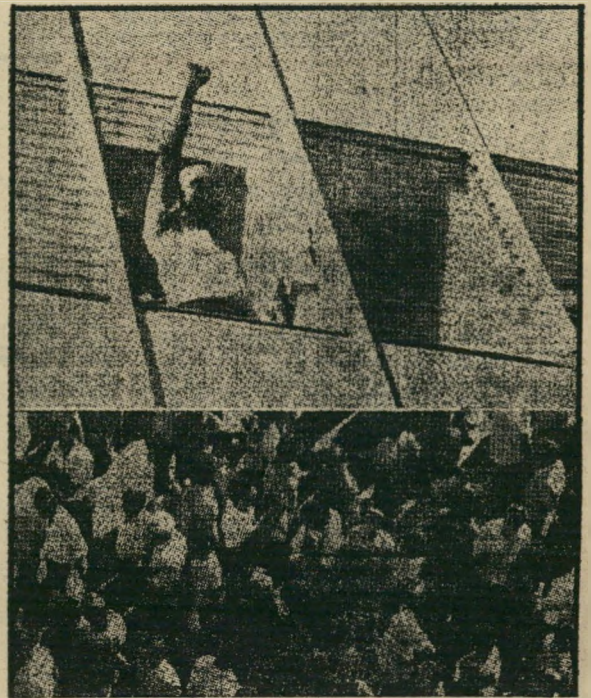
הארץ, 10 ו-8 באוקטובר