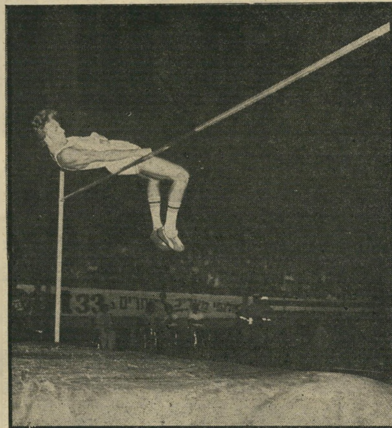
השיא דווייט סטונס קופץ לגובה של 2.20 מטר, וקובע בכך שיא ישראלי בינ- לאומי חדש. האתלט הור הקודם שהגביה לקפוץ בישראל, הצליח לעבור 2.13 מטר בלבד. בניסיונו הראשון לקפוץ לגובה זה נכשל סטונס. אולם הצליח בשני.