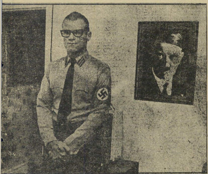
מנהיג סטיוארט כביתו. "זה עניין שולי"

לא שמע על פעולות הליגה (או חליגה-נגד) השמצה של בני-ברית, למשל, נגד המיפי-לגה הנאצית החוקית בארצות-הברית.