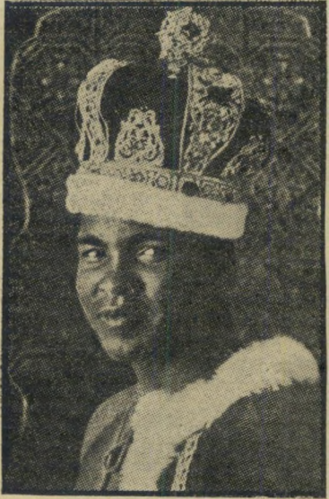
"המוקד" מוחמד עלי הקרב האכזרי ביותר

בסיבוב התשיעי נדמה היה אפילו כי מוחמד עלי עומד להיכנע ליריבו. עינו הימנית שנפגעה במהלומת וו אדירה נס- גרה. כשהוא נשען על חבלי הוידה עצם עלי את עיניו כמי שעיף מכל המהלוי- מות שניהכו על גופו בקצב של הפגזה