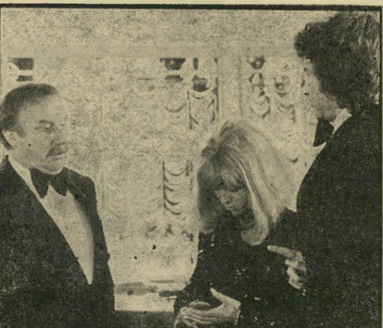
ביטי, כריסטי ווורדן — כמעט מיני

מין וכסף הם שני הנושאים היחידים המעניינים אותנו — ואת הסרט. זהו ברנש שכל-כולו מתרכז באבר הפעיל תמיד, ואילו הנשים הרבות בחייו אמטרות להוות מעין חתך של האשה האמריקאית בכלל: האחת (גולדי האון) בלונדית ילדותית הזקוקה לסרט שלם כדי להתפכח; השנייה (לי גרנט), נשואה מתוסכלת תבוגדת בעל בוגדן עם פרי-הרבעה מיקצועי; השלישית (ג'ולי כריסטי), פרי-פריט שבוחרת בביטחון כלכלי וריגשי, גם אם הוא מתגלם בגבר העומד על סף הזיקנה. דרך אגב מציג הסרט נערה נוספת, בת הדור החדש (קארי פישר, בתה של דבי ריי"נולדס), השונאת את הוריה ומשתגלת כדי להוכיח זאת; אורגיות כמעט נועזות, מסיבות-התרמה פוליטיות כימעט"נלענות, וכן הלאה.