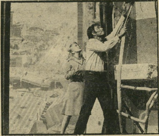
הסטון ומזכירה — הסכנה היא לאוזנים

את התפקידים הראשיים בסרט ממלאים הדיקט והקר"טון, שאילו עין בלתי-בוזחת יכולה להבחין בקיומם