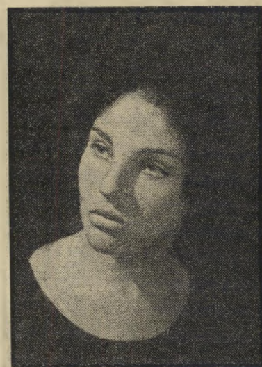
בת 16 ליזה כתלמידת בית-ספר תיכון. באותה תקופה כבר יצאה עם החבר הקבוע הראשון שלה, שהפך אחר-כך לבעלה.

על אחד העסקים הסואנים ביותר של תל-אביב: מיספרת-נשים הומה. היא מנהלת את העסק, מפקחת על העובדים, מטפלת בעצמה בעיצוב קווי התיסרוקות של כמה מהמפורסמות שביהפיות העיר, ומאזינה בסבלנות ובאורך-רוח לבעיותיהן, תלונותיהן ורצונותיהן של עשרות נשים שי המיספרה הפכה עבורן מוסד של בילוי חברתי. ואז, כשנדמה שהיא תשושה ורצוי זה ועומדת לכרוע תחת נטל העבודה, היא מתחילה בחיים חדשים.