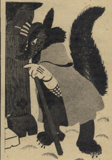
הזאב הרע חורש מזימות מסתתר: הזאב (האב) ד'בוטינסקי

"הו-הו," שרקה הרוח בין השי-חיים; "קו-קו" קראו הרב קוק וה-רבנית קוקיה מן הצמרות, ואילו