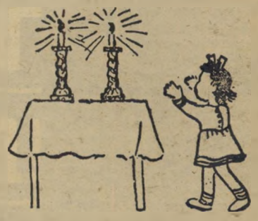
כיפה סרוגה ונרות-שבת ואתה? הדלקת נרות?

הכל החל בשעות הבוקר המוקדמות. כיפה סרוגה ישבה בחדרה והנחיתה תפילין זה על גבי זה, יען כי לא השיגה ידה לקנות לגו. "לכי נא, בתי," אמרה האם, "אל ביתה