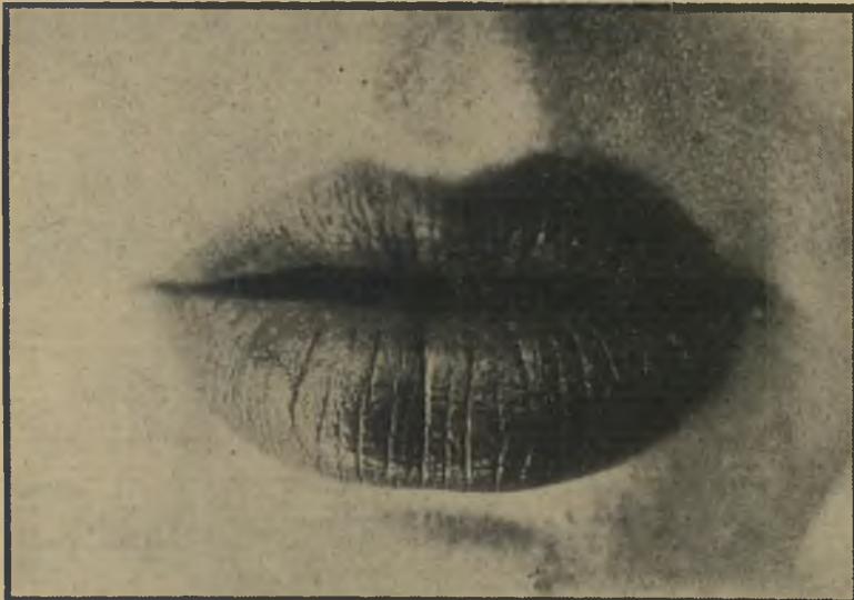
"שפתיים לוחטות" יחס לפרטים

משחקי אורות וצללים המביעים את אותה אווירה מסויימת בה הוא רוצה להציג את הדמות. צילום כזה יהיה בדרך כלל בעל גוונים רבים מכל הסולם הנמצא בין הי שחור ללבן. הצילום העיתונאי של אותו קלוז-אפ הוא בעל דרישות אחרות. הוא מחייב קודם כל בהירות, חדות וניגודי גוונים, כדי שניתן יהיה להדפיסו בטכניקות הדפוס של עתון