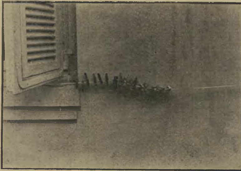
יום, "אין כביפה" יחס למראות היומ-יום

כמו כל צלם מתחיל אחר בעולם הזה, הוא עבר את המשבר הרגיל כשהסתבר לו שעבודת הצילום העיתונאית אינה מזדהה עם מושגיו שלו על צילום. עברנו עמו הרבה ויכוחים עד שהסתגל לדרישות הי עיתון והתגלה גם כצלם-עיתונות מצויין. בדרך כלל אין הצילומים המתפרסמים בעולם הזה נושאים עליהם את שמות הצלמים. אבל כמה מהרפורטזות המצרי למות, המפורסמות ביותר שנתקלת בהן בשנתיים האחרונות על דפי עתון זה, הגיעו אליך באמצעות עדשתו של עידן. העבודה העיתונאית, אותה ביצע במסירות יוצאת-דופן, לא היקתה את חושיו האמ- נותיים. בצד הצילומים שביצע עבור העתון היתה עינו הרגישה קולטת גם קומפוזיציות ומראות אחרים, אותם צילם לעצמו. לבסוף גברה בתוכו הנטייה האמנותית. הוא ויתר על העבודה העיתונאית, יצא לארצות-הברית כדי ללמוד שם קולנוע. ערב פרידתו מאיתנו הוא אסף את צילוי מיו הפרטיים, אלה שלדעתו היו ראויים להידפס בעתון ולא התפרסמו, והציג אותם בתערוכת-יחיד משלו, הנערכת במועדון-התיאטרון בתל-אביב. התמונות המתפרסמות בעמוד זה הן כמה מהתמונות שבתערוכה. הן מצביעות על