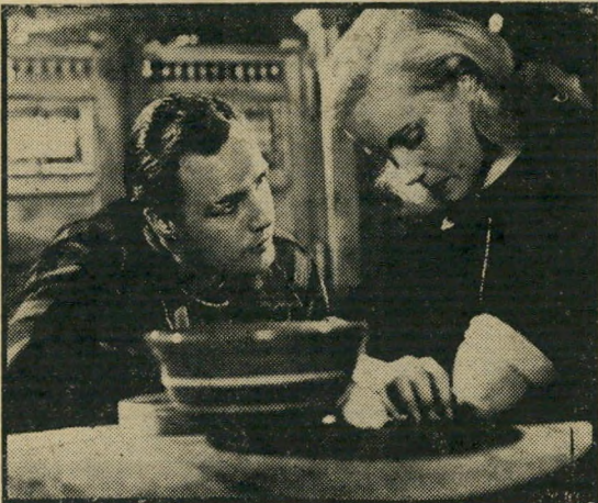
ברנדו ומארי סיינט: אלימות ואהבה

כל זה מבויים היטב, האווירה דרוסה ואמינה, המישר חק ברמה גבוהה. אבל מכאן ועד למסקנה שזוהו מינשר סוציאלי נועז - המרחק עדיין רב. קאזאן והתסריטאי שלו, באד שולברג, מציגים את מאבק-הכוחות על איגוד-ההסווא רים הניו-יורקי, כגרסה עירונית של המערבון הקלאסי: