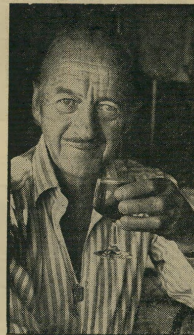
שחקן-סופר גיבן איפה הסוסים הריקים?

בעיקבות ההצלחה הראשונה, התיישב גיבן שוב אל שולחן-הכתיבה, למרות העיי נוי היחסי הכרוך בדבר: «זה קשה פיר מאה ממישחק». אבל, לאחר שנה וחצי