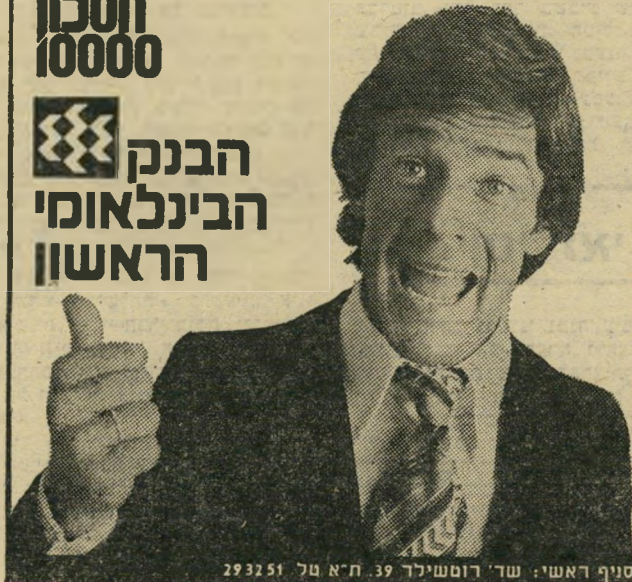
סוף ראשי: שר' רוטשילד 39, ת"א 293251