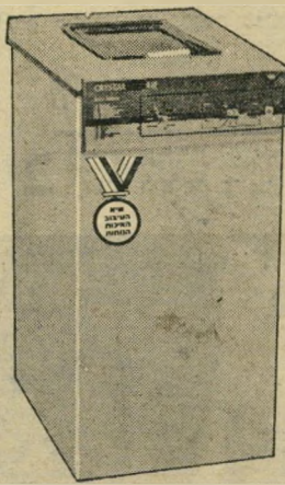
מכונת כביסה "לידי"