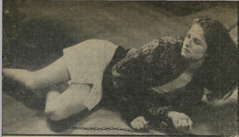
כוכבת ראמפלינג ב"שוער-הלילה" התעלות ופרורטיות

רומה, פרורטיות מסוגים שונים, ויחסי-מין מפורטים צפת יותר מכפי שמקובל לראות על מסכי ישראל.