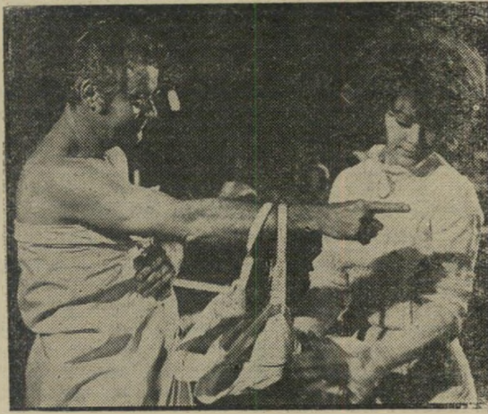
האריס ולמן: בחינחון כלבי

של, מה שוויים של הערכים המקודשים הרבים של אמרי-קה, אם התגשמותם נראית כמו מישחקי-הכדורגל הזה (שהוא הספורט הלאומי שם), או כמו מערכת-היחסים הקור-שרת את הדמויות השונות. ואם מוסיפים לכך בימוי יעיל ומבריק של כל סצינות-הפעולה הרבות, ובמיוחד של המיש-חק, התופס כימעט את מחצית הסרט, ואת מישחקו המשו-עשע קימעה של ברט ריינולדס, והרי סרט שהצלחה מוב-טחת לו.