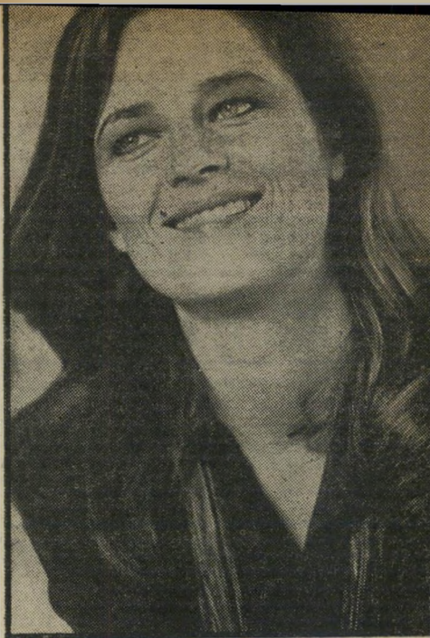
שרלוט ראמפלינג (בחים) כמו צועניה

צופים אחרים, שהפוליטיקה היא עיקר מענייניהם, ודאי מתפעלים מן ההעזה של קואני, המקפידה לתאר את הקשר לרצח