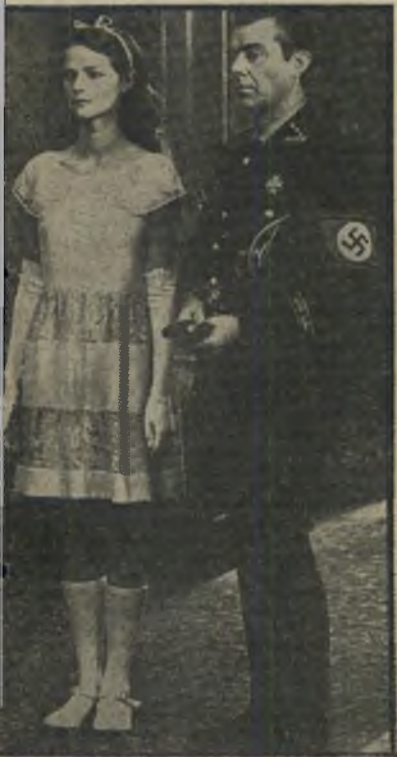
עם דירק בוגארד ב"שוער-הלילה" קשר סאדו-מאזוכיסטי

המראה החיצוני שלה אינו מעיד, לשחות ברגע הראשון, על אלילת-מין. היא צנומה מדי, חזה אינו שופע, תווי-פניה חריפים יתר-על-המידה, וחייה הפרטיים רחוקים מאד מדימוי בריכות-השחייה וחדרי-השינה הזורדים של המסורת ההוליוודית. ידועים אפילו הסיפורים על השגים שבילתה בקרוך-