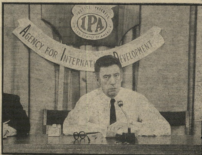
3. האמריקאי (צרפת)