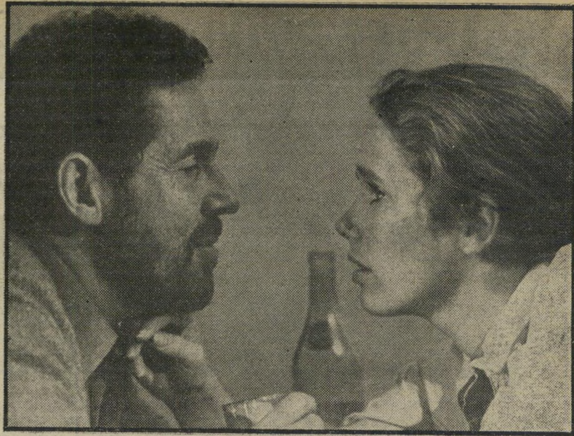
1. תמונות מחיי נישואין (שוודיה)