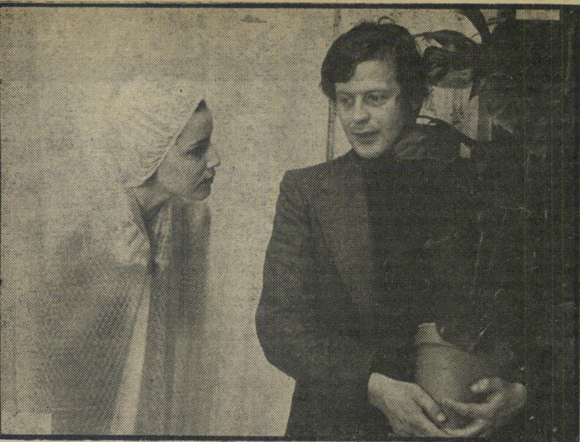
2. אהבה אחר-הצהריים (צרפת)