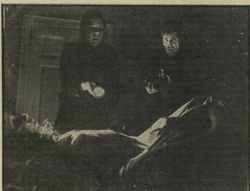
1. מגרש השדים (ארצות-הברית)