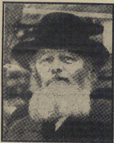
הרבי מדובאביץ' דרוש מיטבח?

עשרה גושי-הבניינים שבין הרחוב האר- בעים לרחוב החמישים, בשדירה החמישית