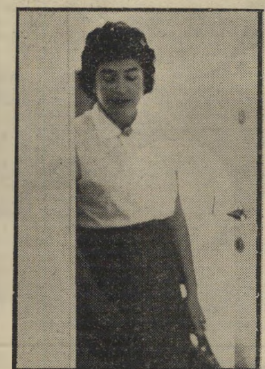
שופמת אבנור מדוע עונש מאסר?

ביקרו השניים בדירתה. הם ביקשו שהיא תשכח את עדותה במיטרה. אחד המבקרים החדשים גילה כי ידוע להם שלליליאן יש דירה בבתיים. אם לא תעשי מה שאומרים לך, איימו, נשרוף לך את הדירה." שוב הלכה למיטרה. שוב מסרה פרטים על הכנופיה שאיימה עליה, ושוב הופיעו השניים מבלי שהמיטרה תתפוס אותם. באו אימים נוספים, ולבסוף נשרפה דירתה בבתיים. אחר-כך הועלתה באש הדירה שבה עבדה, ברחוב יהודה הלוי 139. היא נותרה ללא בגדים, ללא פרוטה, ללא מקום-לינה, עם ילדתה הקטנה. כאשר גילתה ליליאן לעיתונאי, שאחד מראשי מיטרת מחוז תל-אביב הציע לה לעזוב את הארץ כדי לא לסכן את עצמה