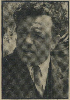
קודק "עניין אבוד!"