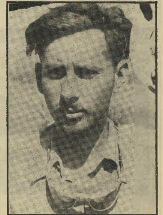
העיפוח והאימה: אבנרי למחרת הקרב הגדול על עיבדים