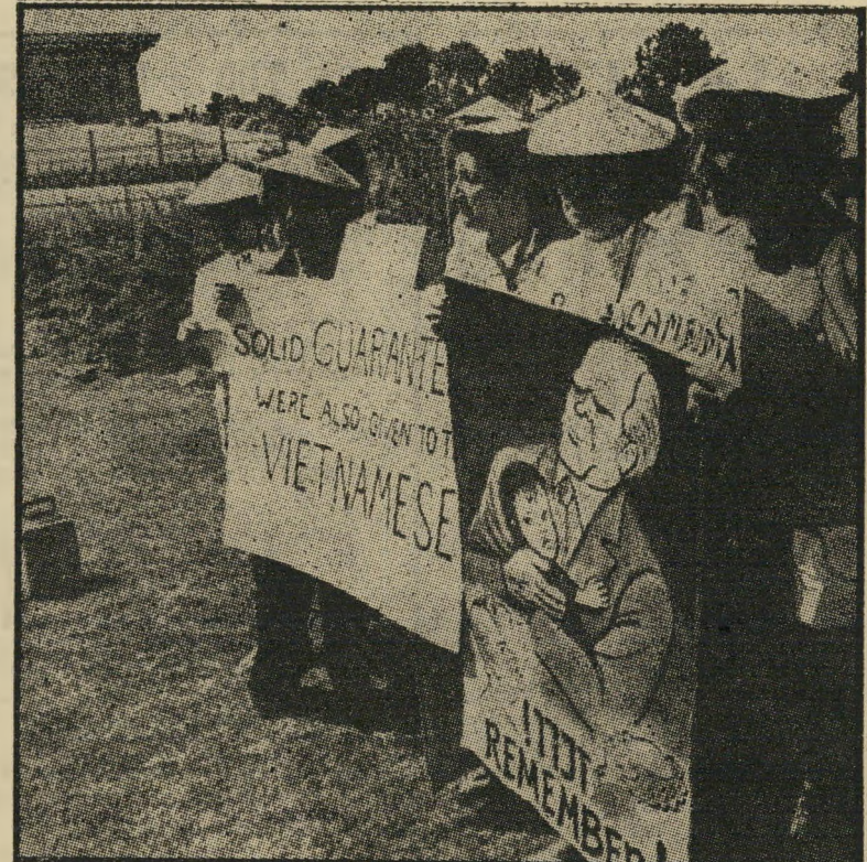
הפגנת נשות, "המענה השלישי" נגד קסינג'ר מה שהיטלר התחיל

כך, למשל, מתכוונים אנשי גוש אמרי נים להטיל מצור על בית-המלון בו תשהה פמלייתו של מוכר המדינה האמריקאי בכל תקופת ביקורו בישראל. על פי התיכנון אמורים הצרים להתנגד ככות לכל ניסיון סינוי, אפילו יביא הדבר להתנגדות עם כוחות המיטרה, למעצרים ולמאסרים. המטרה היא ליצור מכסימם של פירסומת רעשנית כדי ליצור בעיני אמצעי-התיקשורת הבינלאומיים שיסקרו את מסעו של קסינג'ר את הרושם, כארי לו התקבל קסינג'ר בישראל כאויב-העם. קבוצות קיצוניות אחרות מתכוונות ליבש את מסעו של קסינג'ר באמצעות חסימת-דרכים, הפרעות קולניות וניסיונות חדירה למקומות בהם יששה. אולם חמור יותר מכל אלה הוא המידע, שהגיע בימים האחרונים לכוחות-הביטחון, כאילו קיימת כוונה להתנקש בחייו של קסינג'ר. מודיעין שהוחדרו לתוך הקבוצות המיליטארי דובריים והתלחשויות בקרב אותם הורגים לפיהם, "קסינג'ר אחראי באופן אישי לשואה שהוא עומד להמיט על ישראל ומשום כך יש לעשות הכל כדי לסלקו".