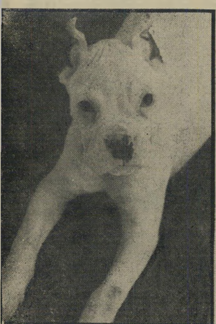
ארו הפרט החסר

תודה להעולט הזה (1976) על רשימתכם על הבוקסר הלבן שלי, שנגנב. אנשי המישמר-האזרחי הכירו את הכלב