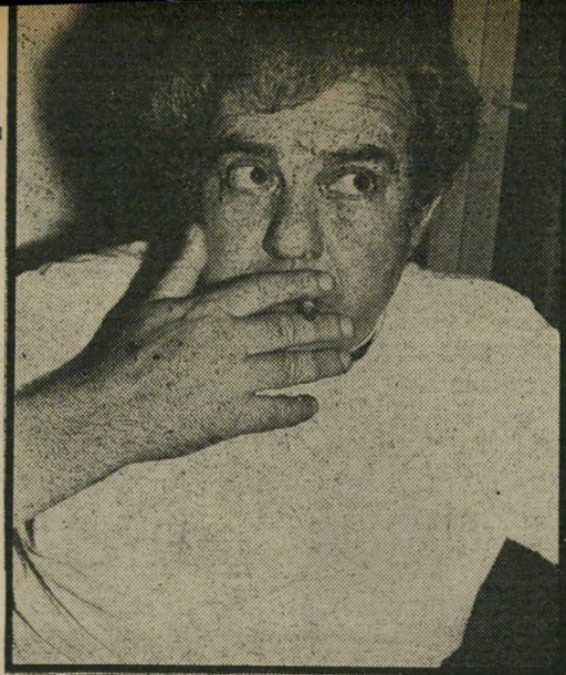
"רובינון קרוזו הוא ספר פוליטי..."

לכל עם, לכל חברה, יש תבטאות: בארכיטקטורה, בשירה, בדראמה, בכל יצירה שהיא. אם תיקח את היצירה הישראלית, אני חושב שישא הביטוי שלה הוא דווקא במחנה-השלום! אני חושב שדושי, וקישון, ומשה שמיר, שייכים למיעוט של היצירה הישראלית, ורוב היצירה הישראלית המשמעותית הוא דווקא במחנה-השלום. אם תיקח את התיאטרון, והסיפורת והאמנות של עשר חמש עשרה השנים האחרונות, הם כמעט נכס בילעדי של מחנה-השלום. זהו, בעצם, קולה האמיתי של החברה הישראלית, וזהו קול העתיד. גם באמריקה, לפני גמר מלחמת ויאט-נאם, הקול האמיתי של אמריקה — אף-על-פי שבמישאלים זה לא הוכח — היה הקול של מחנה-השלום. כי הקול של התרבות, והיצירה והאינטלקט האמריקאי, היה הקול של מחנה-השלום האמריקאי. אותו דבר היה בצרפת לפני גמר השלום האמריקאי.