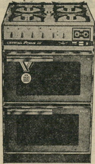
תנור בישול "פרינס"