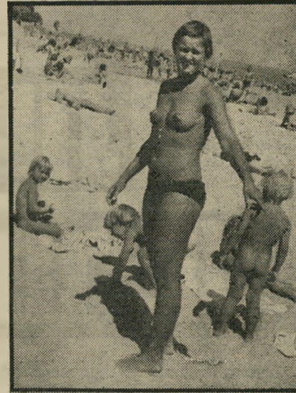
אופנת-הים בדנמרק דו-ימין במקום מין

מרק, משמש כיום אחר-תירות המושך תיירים כטיבולי וכפסל בתולת-הים הקטנה. באדישות מוחלטת סוקרות הנערות ה-דניות, השרועות על תולות החוף כשהן חושפות עצמן לקרני השמש, את מבטיהם הרעבים של תיירים מאיטליה, מישראל ו-מדינות ערב. כל עוד זורחת השמש, גדוש החוף.