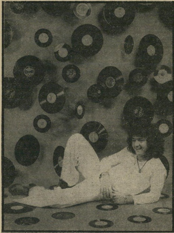
עוזי פוקס אחרי פסטיבל חסידי

ואם כבר מדברים על בית, אז הוא בסך-הכל מתגורר בדירה בת שניים וחצי חדרים בחולון, ונוסע במכונית ישנה דגם 1964. אבל אם את בכל זאת מתעקשת, אז שתדעי לך שעוזי פתח מישרד מצוחצח עם טפטים, וילגונות ושולחן מעץ-אלון ופוסטרים של עוזי פוקס, עם תקליט-זהב של עוזי פוקס ומוכרה של עוזי פוקס, והוא גם מבטיח הגיגית לאיזה כל מעריצה שבאה לבקר אצלו, ואפילו לתת לה חתימה עם נשיקה במצח.