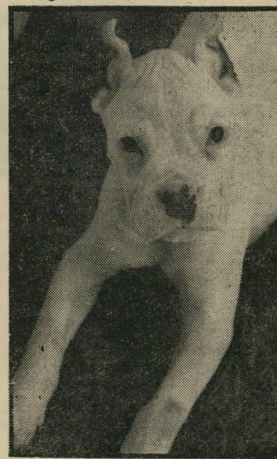
הבוקסר — כמו בן-אדם!

מדי בוקר היה יוצא לבדו מדלת בית המלון, שם את פעמיו אל גן-העצמאות הסמוך, עושה את צרכיו, וחוזר כלעומת שבא. התיירים היו מלמלים אותו, עובדי בית-המלון היו קוראים בשמו. עד היום החמישי האחרון. באותו יום חמישי הלך הבוקסר כרגיל לגן-העצמאות, כאשר שרשרת-המתכת הי' כפולה לצווארו. הוא לא חזר. "כמו בכך שלי" מאז שורר האבל בבית שרתון. אך בשום מקום אין האבל כבד יותר מאשר בבוטיק-הבגדים שלייד טרקלין המלון. כי בעלת בוטיק בני, היא בעלת הכלב. מאז שנעלם הכלב, אין רחל אייכנר הי' שחרחורת מוצאת מנוחה בנפשה. היא קיבלה את הבוקסר הלבן כשהיה חינוק בן