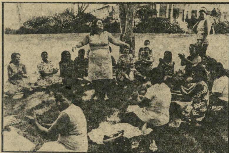
הנופשות של רבין התנאי: ריקודי-בטן

שק-השינה, שמחירו לצרכן מגיע ל-250 לירות, מורכב מבד עליון עשוי ניילון הי-דוחה מים, ומבד תחתון כותנה-חאקי. המילוי שלו הוא מפוליאסטר מיוחד, ומי-דוחה הן 75x190 ס"מ, כשיש לו גם כובע