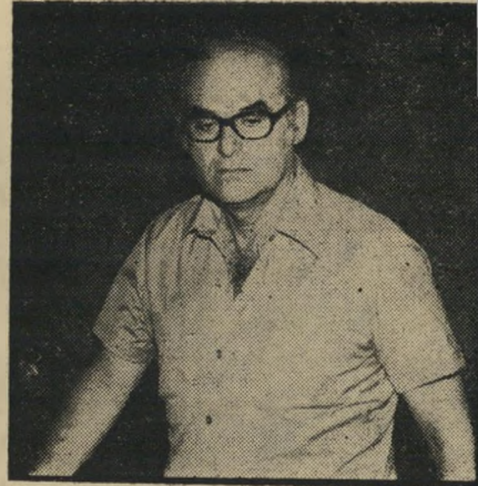
הקואופרציה ישראל דיו, יושב ראש מרכז הקואופרציה, קודם היה שליט אגד.