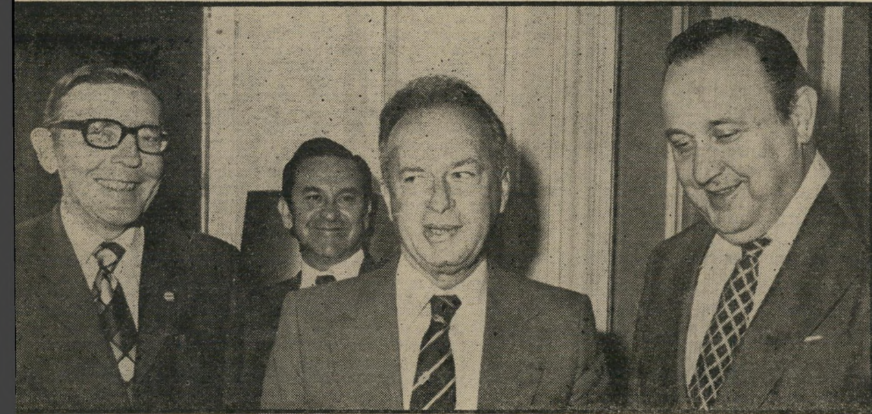
שר-תחזוק גנשר, יצחק רבין והשגריר הישראלי יוחנן מירון

..אם תמשיך לעשן בקצב הזה, יגידו שהתמוטטת!"