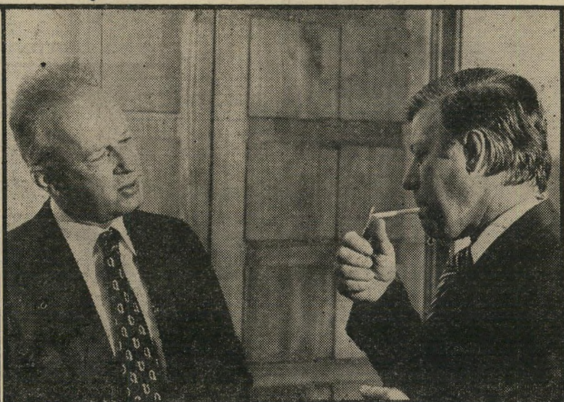
רבין בשיחה עם הקאנצלר הלמוט שמיידט

..מזמן לא ראיתי כליך הרבה שוטרים אשכנזים!"