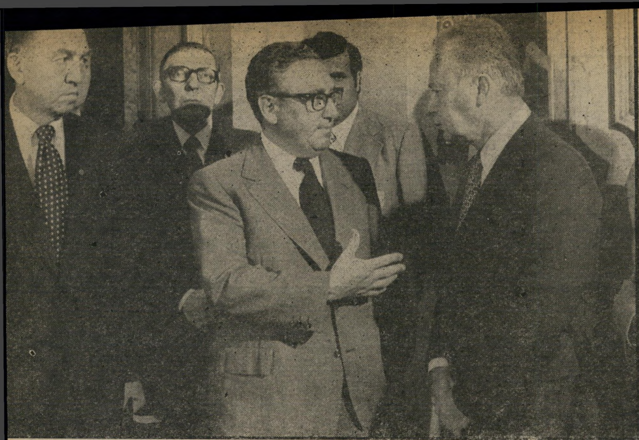
יצחק רבין עם הנרי קיסינג'ר וג'וזף סיסקו