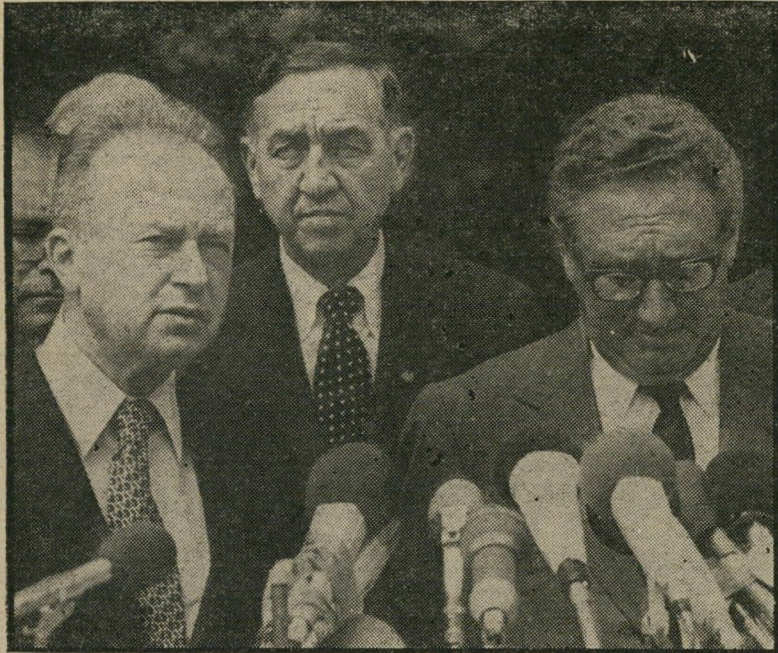
בון: קיסניג'ר ורבין דנים על הסדר ביניים בסניף שאחת ממטרותיו העיקריות - לנטרל את הפלסטינים