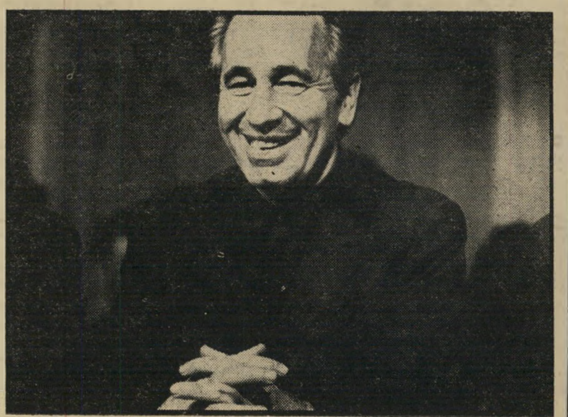
שריחביטחון פרס צוחק מי

פיסקה זו חמורה ביותר. היא תאפשר מעתה למערכת הביטחון לייבא מוצרים בחו"ל עבורם שולם בדולרים, במקום לקנותם בתעשייה המקומית בלירות. מערכת הביטחון החלה לאחרונה לקנות בחו"ל מוצרים במקום בארץ, מפני