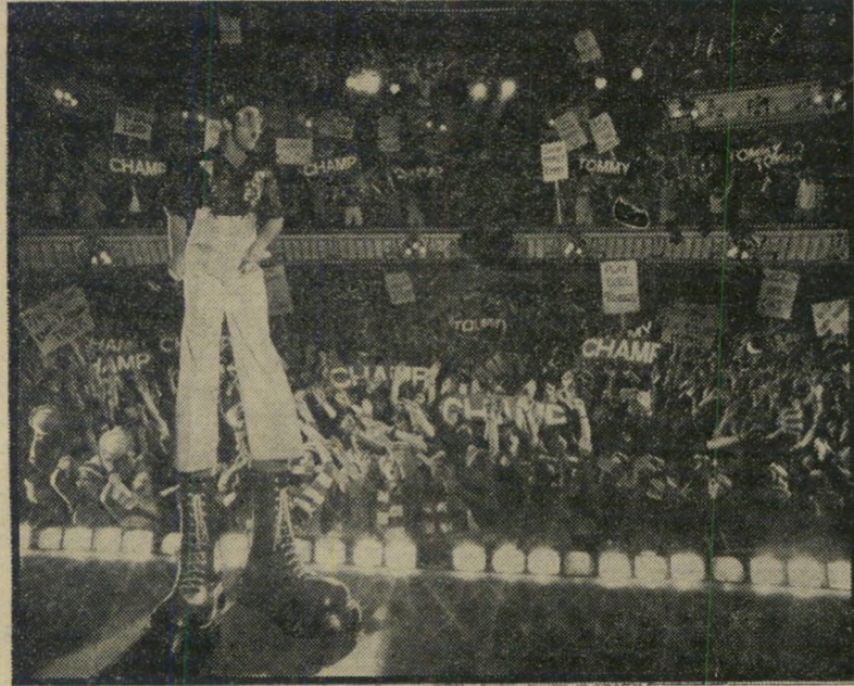
פולחן-אלידי-חשמלי לארטוק ג'ון לטגוד למכונות המישחק

שנה האחרונה, יוצג בקרוב בישראל. "חשתי שאם אצטרך להמשיך לדחוס את כל מה שיש לי לומר בתוך שירים בני שלוש דקות, המטפסים במיצעד הפזמונים ונעלמים לעד, לא אוכל לעולם לומר הר"בה". כך מסביר היום טאוונשנד את תשוקתו לחרוג מן הקארירה המצליחה של יצרן-להיטים בקבלנות ואטרקציה בימתית בלתי-רגילה (הוא ושאר המי נהגו להרוס,