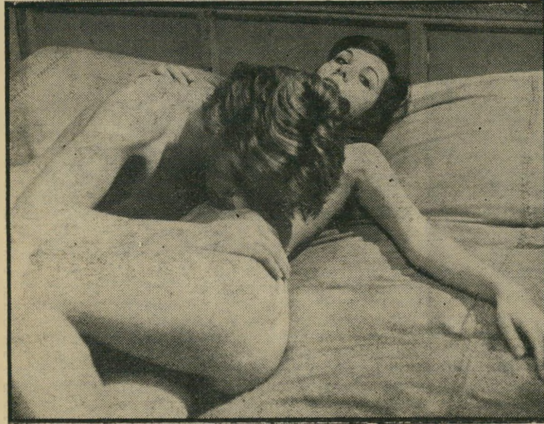
"מציצים בחדרי מלון" פורנו רפה כן

מוכן שאפשר לצרף לרשימה את יומנו של מנקי-חלונות (עם מנקי-חלונות הר משרת ועקרות-בית לאו-ידוקא בענייני הניינה), או את יומנו של נהג משאית (סליחה, לוח יקראו לפני יקרי), שבו נהג-משאית מפור את כשרונותיו לאורך מסלול נסיעתו. זיקפה לריפוי. מבחינה טכנית, מה שמותחן לכל אלה, הוא העובדה שי-