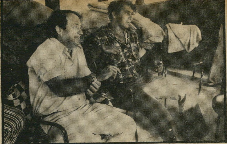
ח"כ פעיה עז סירת קצא"א ה-1970 — במומו פוטל

מיפלגות — גם בעיריית תל-אביב" (העולם הזה 1970). אולם כשהתחלתי לבדוק את שמות המוסדות, התבררה לי עובדה מפתיעה. מתוך כ-130 מוסדות המופיעים ברשימה, 19 חוזרים פעמיים במקומות שונים. הסכומים המהוייבים ואחוזי התשלום מטעם העירייה זהים בכל המקרים. (המשך בעמוד 8)