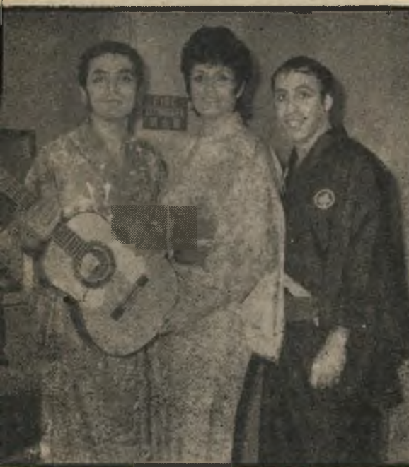
יפה וצמד הפרברים ביפאן העברים שמרו על קשר