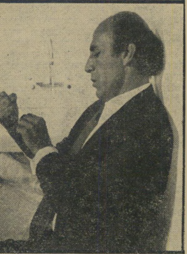
שידוך (כמשורר המתאבד) צריך למות במטולה