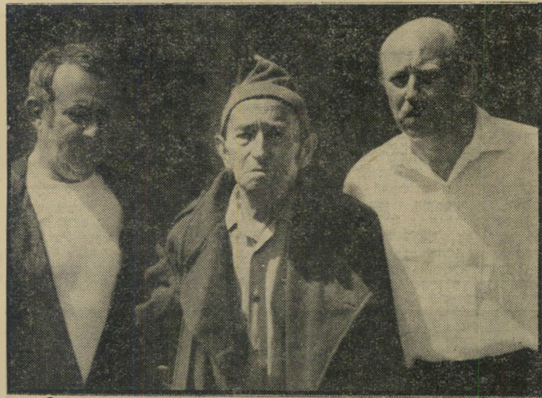
אקלקעי, גודר וחזקיהו ב"הגיגה לעיניים" אסור להיות עיר קטנה

בעליצות את בניו, כדי שיוכל לעבוד אחר-כך את זיכרם; והו עם שבו הוותי קים עסוקים מדי במה שקורה בצלחת של השכן מכדי להבין שכל המציאות סביבם השתנתה.