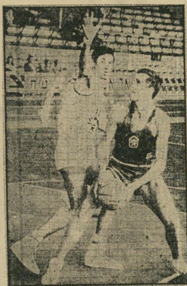
לא לא לא ניתן את רבין ל... א. שרון (שחקן חיוק בלב) חוסס פריצה מן האגף הימני.

ואתו פורד שיצאו עיניו מקנאה ותפקע מררתו ואין מר רבין שועה לו, ומשוחח עימו או עם שר חוצו. עד שינערו חוצנם מאותם ערביאים וישובו בתשובה שלמה ובחרטה גמו- רה. וראוי שיחרטו כל שליטי עולם דבר זה על ליבם.