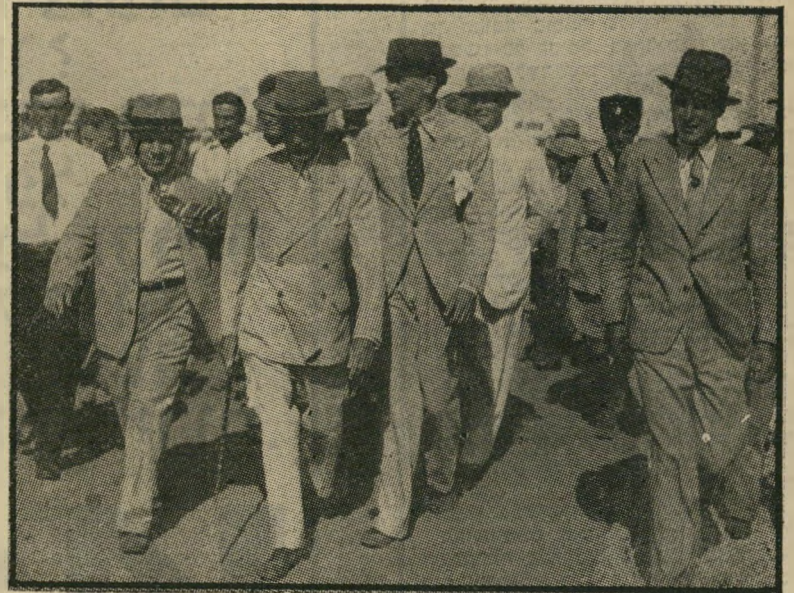
קאראדון (מימין) בנתניה, 1933 • „מושל קולוניאלי שנגמרו לו הקולוניות...“

רות. ישב על מירפסת בניין ימק"א בירושלים המיזרחית, והשקיף על הנוף הירוק שלמי המרהיב. „אני מרגיש שזוהי הזדמנות גדולה. כל הגורמים במיזרח התיכון ובעולם מתאיי-מים עתה לכינון שלום, שלום אמיתי ומלא. „אולי זוהי ההזדמנות האחרונה. אם תהיה מילחמה, יתכן שתיהרס דמשק, יתכן