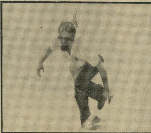
יוצא מהמים - כיסוי צמוד לשבותים