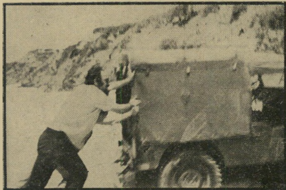
ורוחף את הניירת

תפסו, עצרו, גיסו לחקור ושיחררו. שער תיים של אמבטיה סייעו לעידן להסיר מעליו את שכבות מלח הים, רק אז מיהר למערכת עם סרטי הצילום. הוא הספיק להגיע בזמן, שעות מיספר לפני הופעת העתון, עם צילומיו.