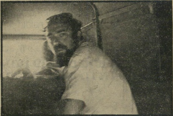
בתוך ניירת המישטרה