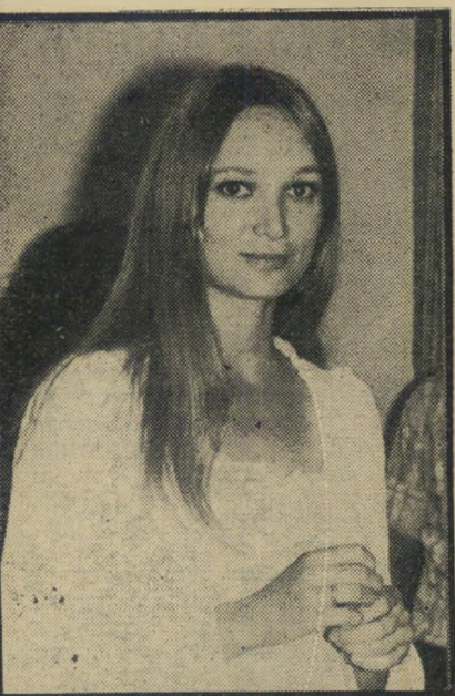
שוטרת עתידה מינקר

בדרך-כלל הוא מצייר אחרי שהוא רואה את התמונה בראשו. לפעמים קורה ש"כשהוא מביע את רעיונו על הבר, משת"