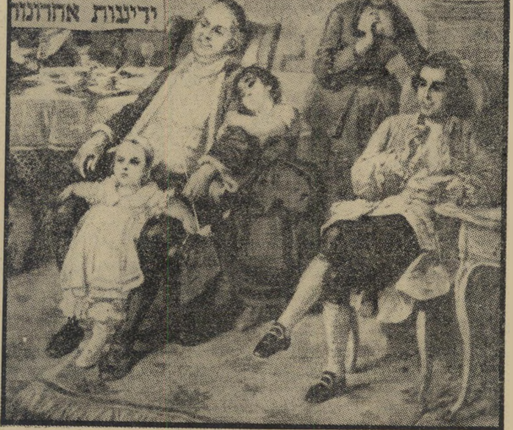
משפחת רוב: במרכז רוב הציבור (יושב), מימינו (בעיניים בוחות) בנו רוב דומס, מתחתיו (פרצוף דבילי) הרוב השקט. האשה מימין (בלי ראש) דעת הקהל — אשתו. אוכלת הממשלה.

— מגלה סקר של המכון למחקר חברתי-שימושי לדעת רוב הנשאלים אין להיכנע ללחצים אמריקניים בדבר חזרה לגבולות 1967 □ 54 אחוז מאמינים שתוך שנה-שנתיים תפרוץ מלחמה