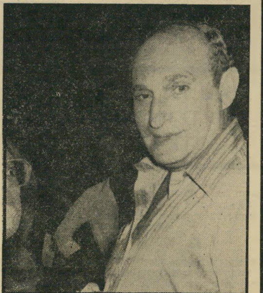
שייקה ירקוני "שאל את הפקידים!"