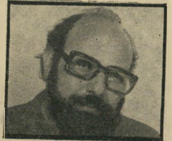
מקסים גידן עריצות

כל הדברים הללו לא צמחו בחללו של עולם, ואינם התפתחות מיקרית. מדינה שקמה על עיקרון של בילע-דיות — שבה רק סוג מסויים של אנשים יכול להיות בעל מלוא-הזכור-יות — נידונה לעריצות. כשהיא מדי-נה מורכבת מאנשים בעלי איכות גבוהה, טיבעי הדבר שמדי פעם בי-