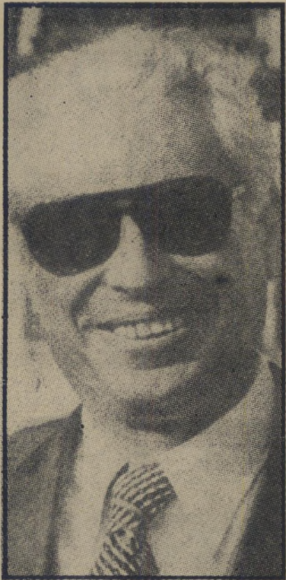
לפני הנפילה פנים זוהרות, חיוך של הצלחה, הופעה של מנצח. הגאון הפיננסי של ישראל, הבטוח שהכל מותר.