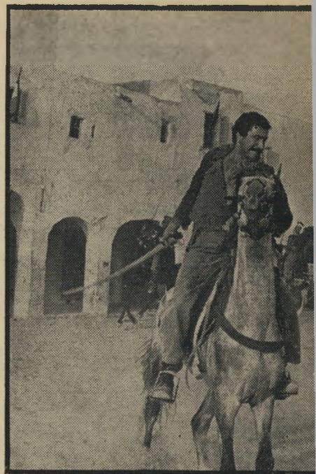
נציג אלג'יריה שכמעט ואנס את הפסטיבל להעניק ז'ון הבמאי והמפיק כאחד השתמשו בלחצים ובאיור גם הפרס הגדול, אחרת נחרים אתכם בצפון אפריקה.

הסרט, מסע השחקנים של תיאור אנגלוי פולוס, אפופיאה הנמשכת באיטיות רבה