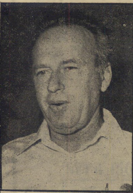
יצחק רבין עדיין אין סוסים בכנסת

אולם גם מכרים אלה הודעו כאשר התפרסם השבוע, ימים מעטים אחרי שגאנדי די זכה בור זה של על-ידפנה מפקקים. כי יצחק רבין העניק לגאנדי מינוי נוסף, והפעם בעל משמעות חמורה ביותר, גאנדי הפך יועץ ראש-הממשלה לענייני-ביטחון. קצב בראש. כדי להבין את מלוא חומ"רת המינוי הזה, יש לעמוד על תוכן התפקיד. מכל המחדלים הנוראים של יוסי-הכיסור רים, היה הכולט והחמור ביותר היעדרו של מוסד שהיה מסוגל להעריך את משמ"עוּתם הפוליטית-צבאית של מימצאים מודיי עניינים. אמ"ן ידע לפני המלחמה על כל ההכנות של המצרים והסורים, עד לפרט האחרון. הוא ידע כי הכנות אלה הות למתלימים הקבועים בפקודות-המיבצע למיל-חמה. אולם ביגלל תפיסות פוליטיות ומר-דיעניוּת כוזבות ונפשיות, ששלטו ברא-שיהם של חברי הצמרת המודיעינית, הם סירבו להסיק את המסקנה המתבקשת מא-ליה: שעומדת לפרוץ מלחמה. זהו המחדל הקטן שגרם למחדל הגדול. היו קולות רבים שדרשו במשך השנים לחקים גוף מיקצועי להערכת התהליכים הפוליטיים בעולם הערבי. אולם גוף כזה לא הוקם מעולם. גרוש מזה: תחת שלי-טונם של גולדה מאיר ואבא אבן אף התי-נוונו לגמרי מחלקת-החקר ומחלקת-המיזי-רת-התיכון במישר-החוקן. ולמעשה הם חדלו מלהתקיים. על אמ"ן, גוף צבאי (המשך בעמוד 24)