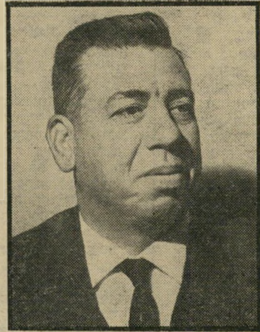
יוף ל"י 27,065.00

בעיות הפילוג והיחסים המעורערים בי מרכז החופשי לא השפיעו על נסיעותיו של מנהיג המרכז והעצמאי, ח"כ אליעזר