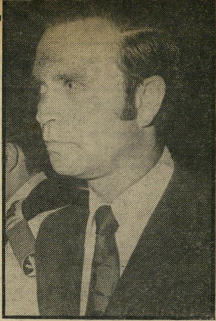
מת ל"י 31,876.80