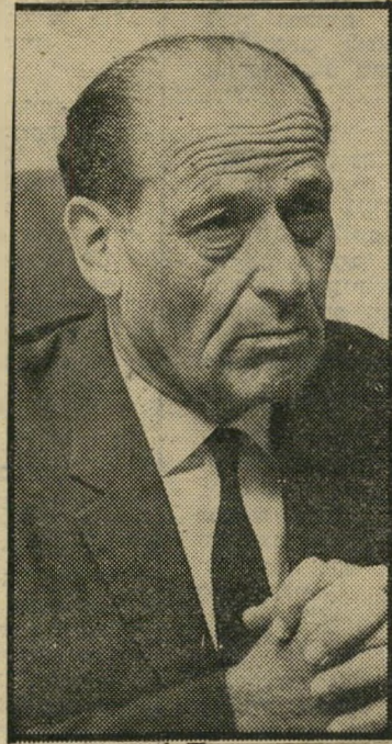
רימלט ל"י 39,494.40

לא כן נסיעתו של חברו של תמיר למיפלגה, ח"כ עקיבא נוף. נוף חוזר זה עתה מטויל בארצות-הברית, ועדיין לא החליט בעצמו מי שלם עבור דמי-הנסיעה שלו. בפני ידידים טען נוף כי היתה זו נסיעה פרטית, שאותה מימנה