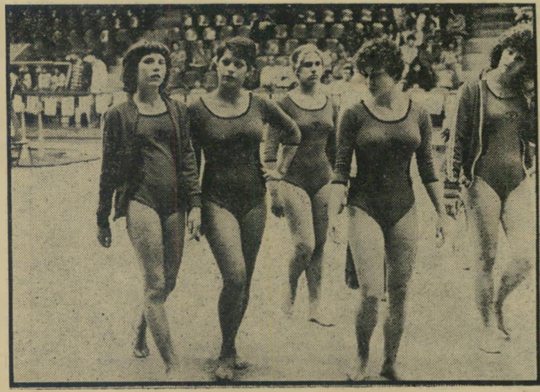
נערות ניבחרת ההתעמלות האמנותית של "הפועל" מיהי מי

ברצוני להתייחס למסקנותיו של אורי אבנרי (העולם הזה 1962), במאמר "ההתי- מוסטות". המסקנות נכונות מאד, אבל לא הובא שם האמצעי להשיג עצמאות כלכלית ואי-תלות במתנותיהם של אחרים. ארצנו מלאה ומשופעת באוצרות, המסוג- לים להפכנו ממושטיידי לבנקירים של ה- עולם, אם רק נגייס את הטכנולוגיה החדי- שה לניצול אוצרותינו הדרומים. (המשך בעמוד 7)