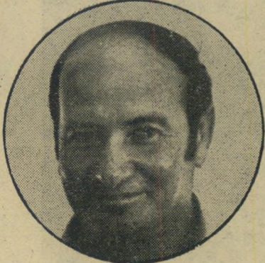
דובר שיפמן מה המחיר?

מי שמחפשים כל-יך בדבקות את הצדק ואת היושר, כדאי שגם הם עצמם יהיו קצת הגונים וישרים. בסיפורים שלכם על "התמונות" (העולם הזה 1965) לא חיפשתם באופן מיוחד לתאר את המיקרה בהקשרו הנכון וב- משמעותו האמיתית, וכתבתם דברים שלא היו מעולם במגמה ברורה להפוך דבר מכובד, יפה וחיובי למעשה עקום ושליילי. הסיפור הדרמאטי של העולם הזה על אופן רכישת התמונות, המחיר המוגזם ש- ננקב בכתבה ובעיקר הכוונה הרעה לנייד עניין ישן שקשור במישרי-התחבורה לי-